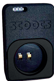
Notice chargeur easyLock 21